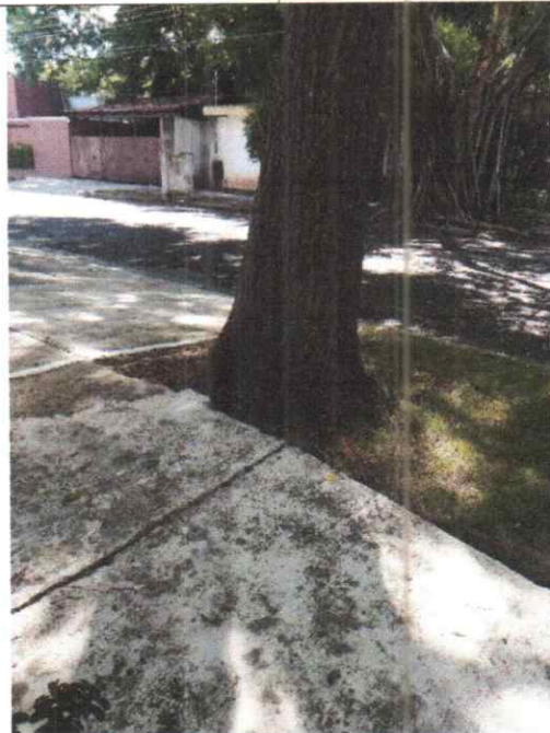
Imagen.- raíz del tronco de los árboles de la especie Macuilis, se encuentran obstruyendo tuberías de aguas negras y el levantamiento de la banqueta.